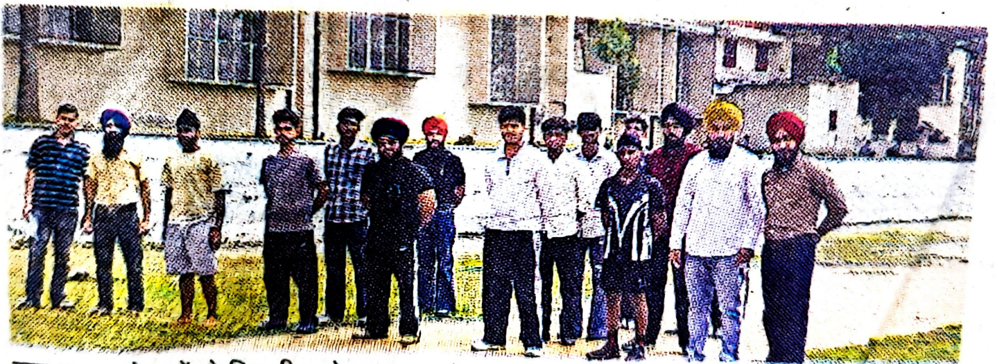
खालसा कालेज में दो दिवसीय खेल ट्रायल दौरान प्रशिक्षण हासिल करते खिलाड़ी

विद्यार्थियों के सर्वपक्षीय विकास के लिए लगातार प्रयासशील है। उन्होंने कहा कि पिछले समय दौरान कालेज के विद्यार्थियों ने खेलों और सभ्याचारक गतिविधियों में महत्वपूर्ण प्राप्तियां करके संस्था का नाम रोशन किया है। उन्होंने बताया कि ट्रायलों का मुख्य उद्देश्य नए विद्यार्थियों को खेलों की ओर प्रेरित करना और प्रतिभाशाली खिलाड़ियों को फीस में छूट समेत अन्य सुविधाएं प्रदान करना है।