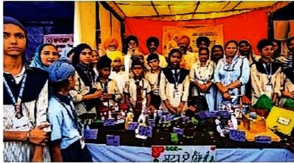
ਤਿਆਰ ਕੀਤੇ ਮਾਡਲ ਦਿਖਾਏ ਹੋਏ ਵਿਦਿਆਰਥੀ ਅਤੇ ਨਾਲ ਖੜੇ ਮੁੱਖ ਮਹਿਮਾਨ।