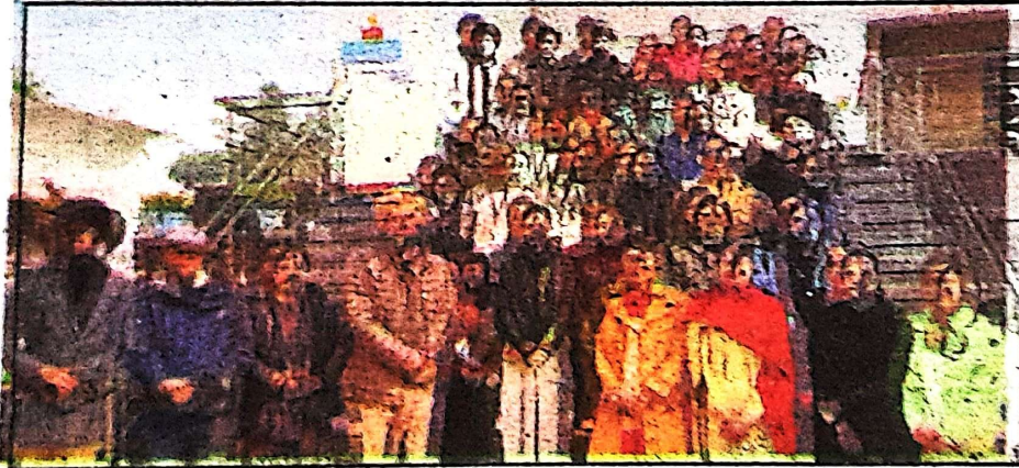
ਖਾਲਸਾ ਕਾਲਜ ਵਿਖੇ ਮਨਾਏ ਨੈਸ਼ਨਲ ਸਟਾਰਟਅੱਪ ਦਾ ਦਿਵਸ। (ਦਲਜੀਤ)

ਸ੍ਰੀ ਅਨੰਦਪੁਰ ਸਾਹਿਬ, 16 ਜਨਵਰੀ (ਦਲਜੀਤ ਸਿੰਘ)-ਛੋਮਣੀ ਗੁਰਦੁਆਰਾ ਪ੍ਰਬੰਧਕ ਕਮੇਟੀ ਦੇ ਪ੍ਰਬੰਧ ਅਧੀਨ ਚੱਲ ਰਹੇ ਸਥਾਨਕ ਸ੍ਰੀ ਗੁਰੂ ਤੇਗ ਬਹਾਦਰ ਖਾਲਸਾ ਕਾਲਜ ਵਿਖੇ ਨੈਸ਼ਨਲ ਸਟਾਰਟਅੱਪ ਦਿਵਸ ਮਨਾਇਆ ਗਿਆ। ਇਸ ਮੌਕੇ ਇੰਸਟੀਟਿਊਸ਼ਨ ਇਨੋਵੇਸ਼ਨ ਕੌਂਸਲ ਵੱਲੋਂ ਖੇਤੀਬਾੜੀ ਵਿਭਾਗ ਦੇ ਸਹਿਯੋਗ ਨਾਲ ਪ੍ਰਦਰਸ਼ਨੀ ਲਗਾਈ ਗਈ।